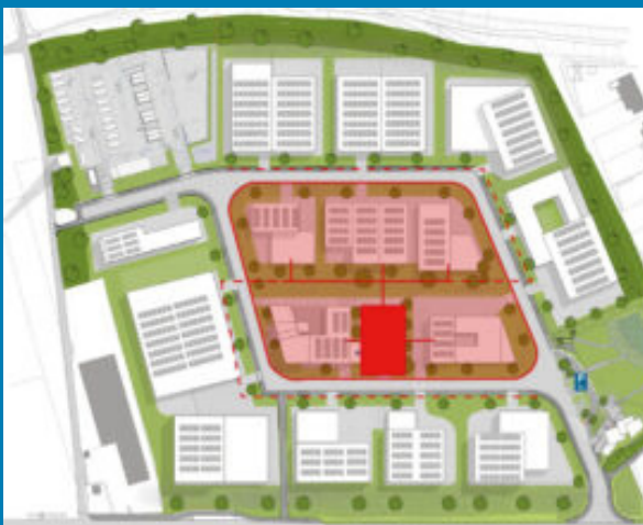
Vijf kantoorpanden (binnencirkel)